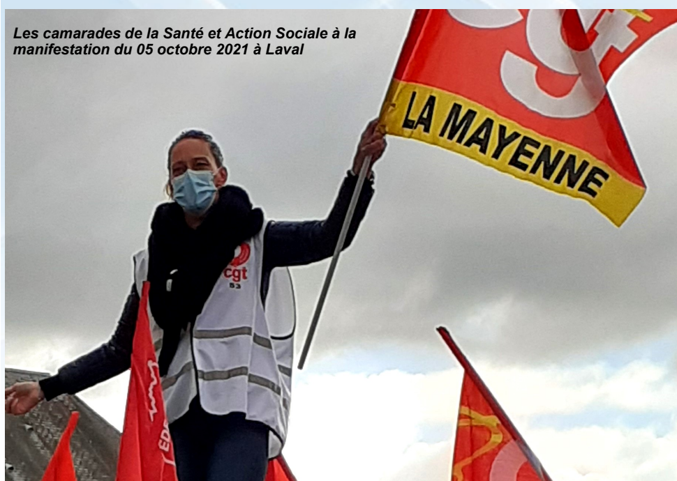
Les camarades de la Santé et Action Sociale à la manifestation du 05 octobre 2021 à Laval