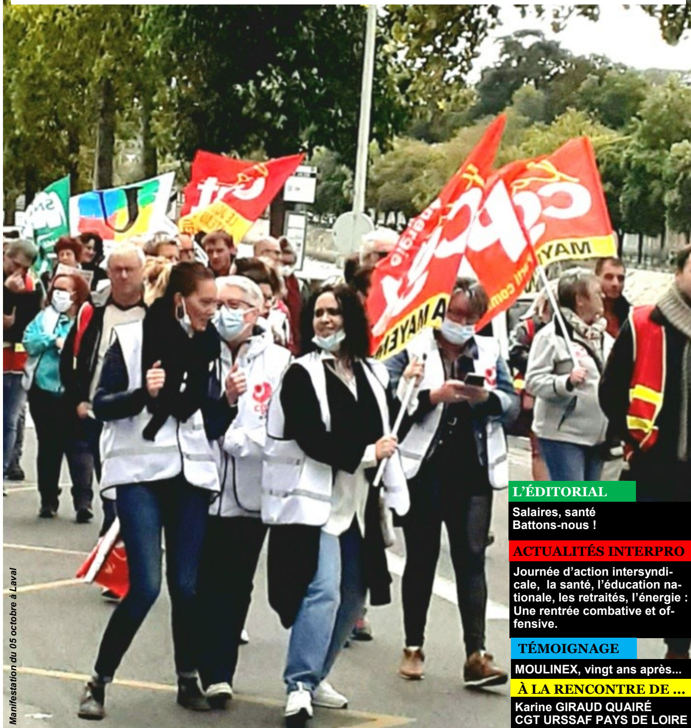
Manifestation du 05 octobre à Laval