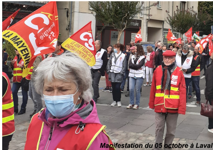
Manifestation du 05 octobre à Laval

L'entreprise Eurovia est une entreprise de travaux publics qui existe depuis de nombreuses années (ex- Cochery Bourdin Chaussé). Pour la première fois, le mardi 5 octobre, les salariés ont dé-