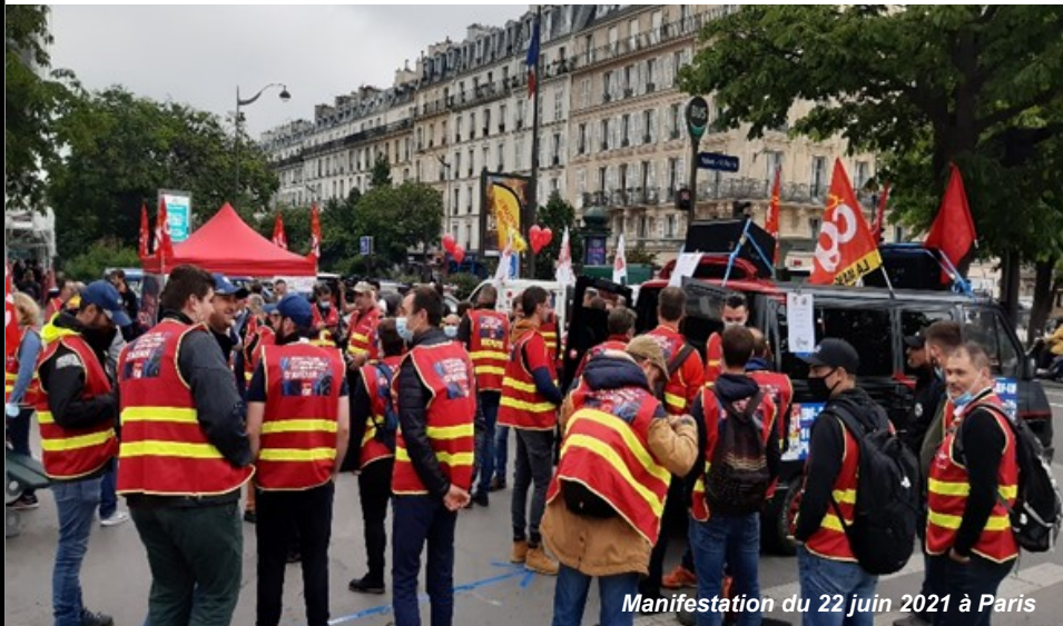
Manifestation du 22 juin 2021 à Paris

L a CGT a largement gagné la bataille des idées sur la nécessité d'un Service Public de l'Énergie.